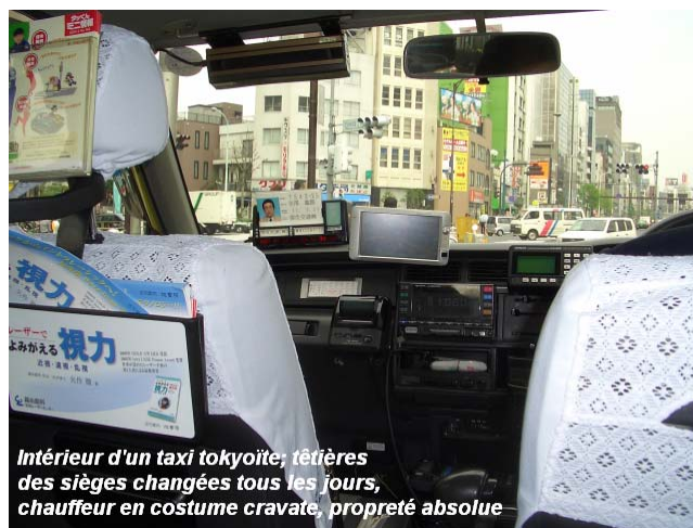
Intérieur d'un taxi tkyoite; têtes des sièges changées tous les jours, chauffeur en costume cravate, propreté absolue